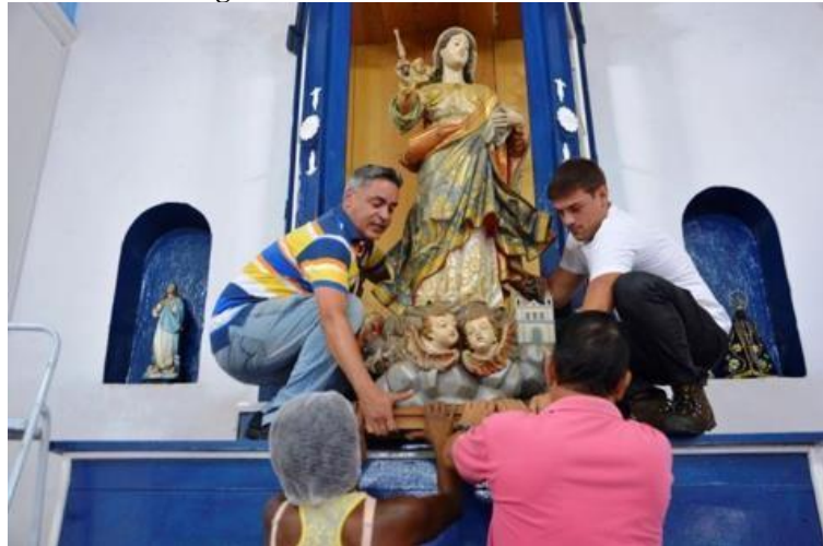
Figura 10 - Nossa Senhora das Neves.