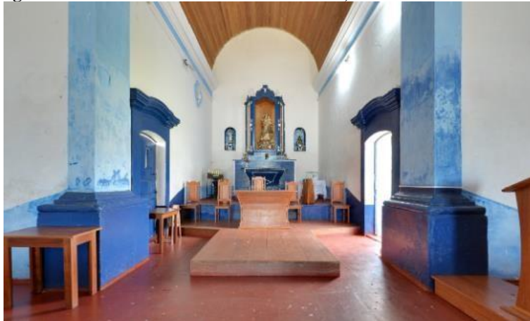
Figura 11 - Interior do Santuário das Neves, em Presidente Kennedy.