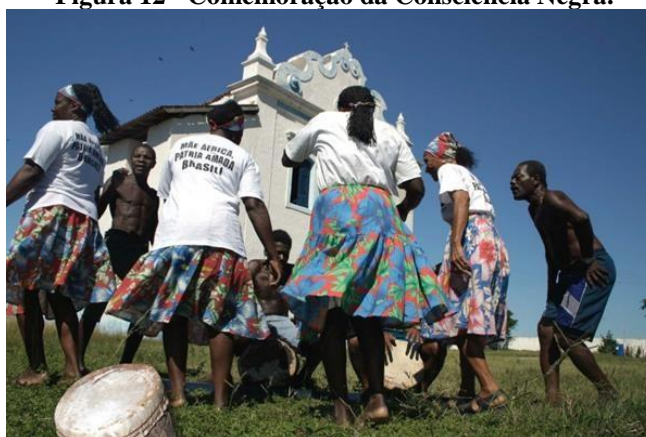
Figura 12 - Comemoração da Consciência Negra.

No Município de presidente Kennedy identificam-se alguns patrimônios imateriais locais, como o Jongo (figura 11), que foi tombado pelo IPHAN e inscrito no Livro das Formas de Expressão, no ano de 2005. A dança representa um dos patrimônios imateriais importantes do município e é produzida de forma coletiva e com elementos da espiritualidade, sendo realizada anualmente por moradores da comunidade Cacimbinha, além desses, encontramos diversos patrimônios culturais imateriais (TAVEIRA, 2021).