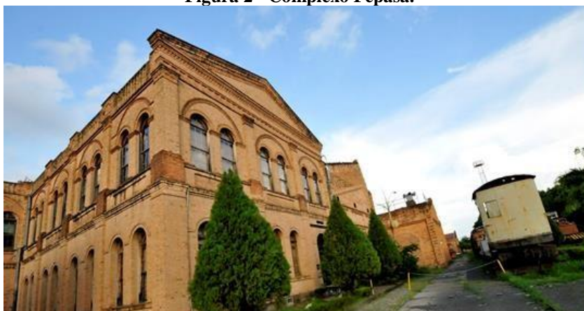
Figura 2 - Complexo Fepasa.