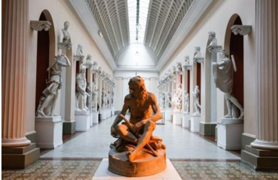
Figura 6 - Museu Nacional de Belas Artes.