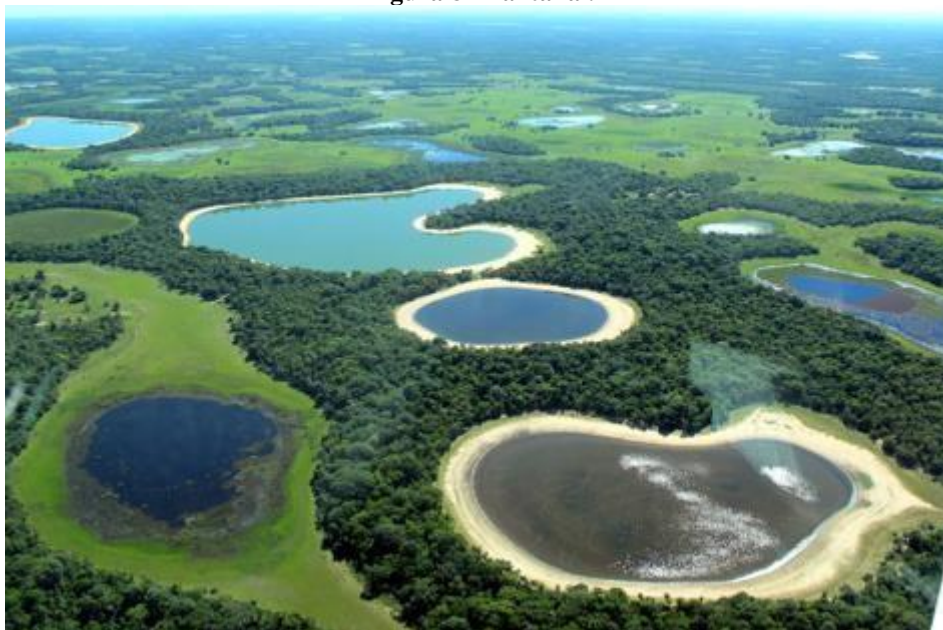
Figura 8 - Pantanal.