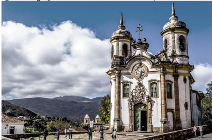
Figura 3 - Igreja da Nossa Senhora do Carmo, Ouro Preto - MG.