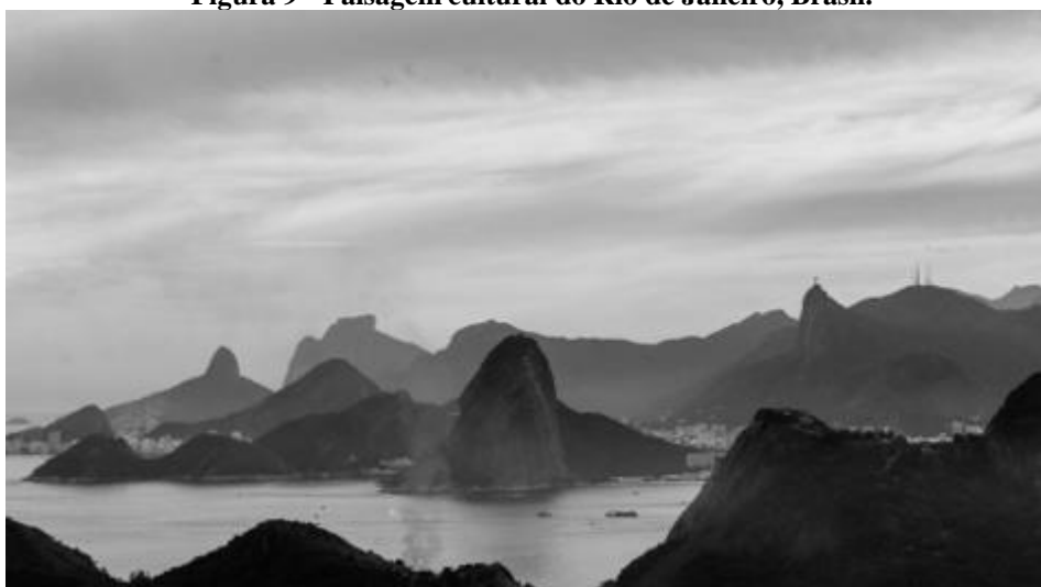
Figura 9 - Paisagem cultural do Rio de Janeiro, Brasil.