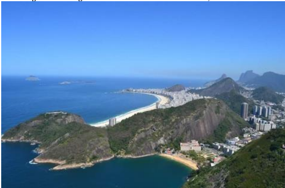
Figura 7 - Paisagem carioca entre a montanha e o mar, Rio de Janeiro.

Ademais, bens naturais, definidos por rios, cachoeiras, fauna, flora, dunas e paisagens (NORAT, 2015), como ilustrados nas figuras 7, 8 e 9.