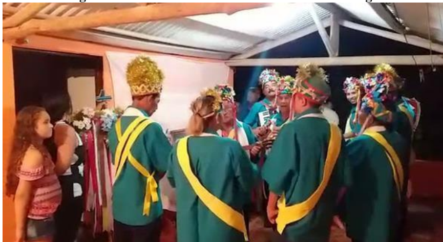
Figura 13 - Folia de Reis Jesus José Maria - Gromogol.

receberam alguns valores em dinheiro por isso (TAVEIRA, 2021). Na figura 12 temos um exemplo de uma das apresentações do Folia de Reis do Senhor Sebastião.